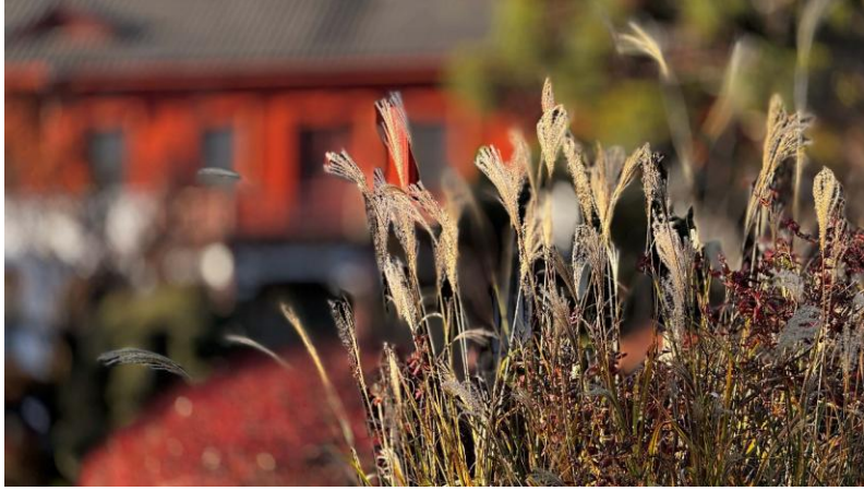
桜井文隆さん (S45/1970 卒)