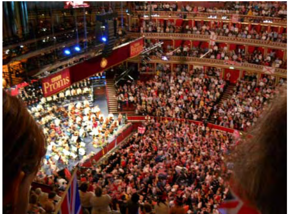
「ラストナイト」天井立ち見席よりステージを望む

それから、ロンドンの夏の風物詩、BBC プロムス音楽祭に行った。最終日の「ラストナイト・コンサート」は毎年恒例のお祭り騒ぎだ（この模様は先日 NHK-BS でも放映された）。何年も前にテレビでこの「ラストナイト」を見たとき、世界にはこんなに楽しいコンサートがあるのだ、いつか行ってやりたいなと思った。大きなロイヤルアルバートホールを埋め尽くした聴衆が、ホールいっぱいに「ラストナイト」伝統の曲を大合唱する。ルール・ブリタニア、エルサレム、威風堂々、イギリス国歌、そして、最後に聴衆全員で隣の人同士手を繋ぎ合って歌う蛍の光…。まったく忘れることのできない感動だ。ホールの当日券売り場に座っていたときに見た景色のことをよく覚えている。それは、気難しいロンドンの天気が見せた、一瞬の青空だった。