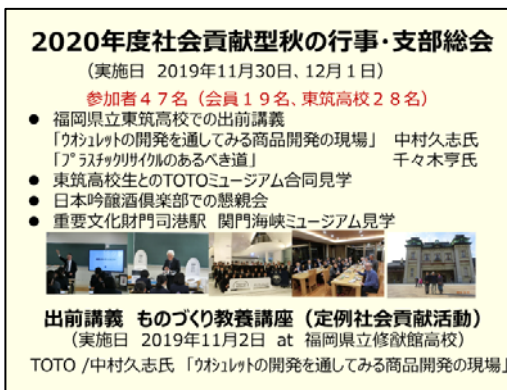
九州支部紹介資料から抜粋

また、京機会活動に顕著なご貢献をいただいた会員に授与する「活動優秀賞」については、「本年度は表彰該当者なし」との報告がありました。