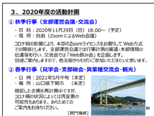
中国四国支部紹介資料から抜粋