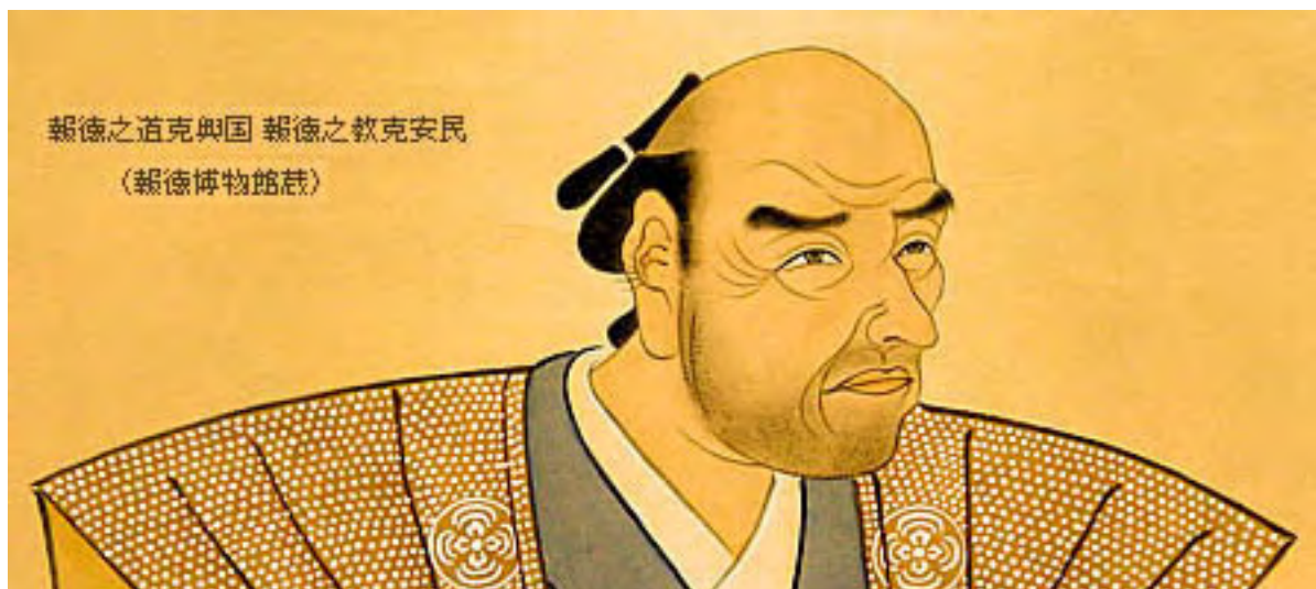
報徳之道克興国 報徳之教克安民 (報徳博物館蔵)

そしていよいよ、小田原藩の仕法にとりかかる。時に天保9年（1838年）尊徳52歳であった。この時、藩主忠真は既に無く、かれは最大の後ろ盾を失っ