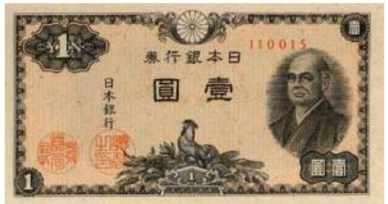
1円に価値のあったころの日本銀行券に描かれた晩年の二宮尊徳像

自分が正しいと主張するところから一歩進んで、人の言葉に耳をかたむける余裕を持つのである。尊徳の60歳台はしかしそのような静穏な収穫期にはならなかった。幕府の命にしたがって、かれ本来の農政家としての能力よりも、むしろ土木技術者としての役割を期待され、いくつかの仕法の計画も役人達の妨害やサボタージュによって成果を上げることが出来なかった。まことに惜しみても余りあることであった。