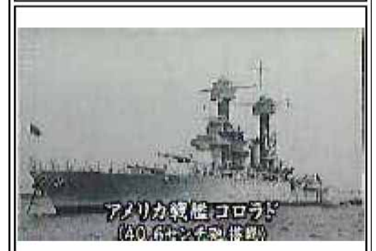
40センチ砲をもつアメリカ戦艦