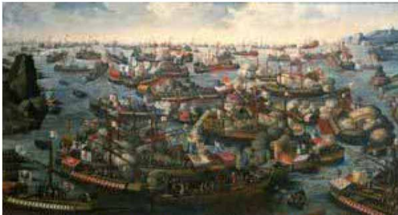
The Battle of Lepanto artist unknown

http://en.wikipedia.org/wiki/Battle_of_Lepanto_%281571%29