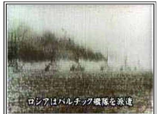
ロシアはバルチック艦隊を派遣

技術の大衆化それ自身が民主化の表れであると共に、それを推進した市場経済もまた民主主義と深く