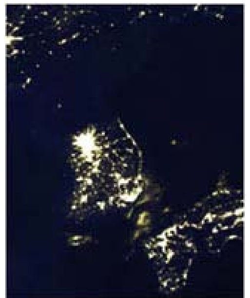
図1 韓国半島と九州・中国四国

だからといって韓国半島に暮らしているすべての人が豊かな生活をしているとはいえない。北の半分は昔のまま、つまり植民地化されたときと同じだ。人工衛星で取った写真をみたら、私の話が実感できると思う。北韓では電気が足りない。だから夜は真っ暗だ。なぜ、こんな差が出てきたのか？答えはイデオロギー（理念、IDEOLOGY）だ。政治体制の差が正反対の結果を生み出した。そのイデオロギーの問題が南北間だけではなく、韓国(South Korea)の中でもある。つまり、目に見えない線があり、両方側が戦いを続けている国だと思ったほうがいい。その前提で現代の韓国社会をみたらいろんな事件がなんとか判りやすくなる。特に外国人に。