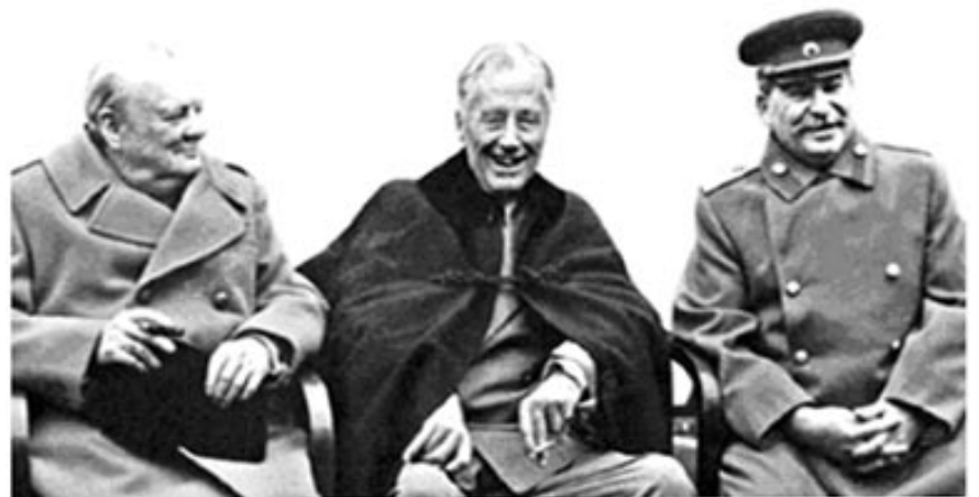
図2 ヤルタ会談（チャーチル、ルーズベルト、スターリン）

国の歴史、世界の歴史はそのときの指導者がどのような価値観を持っているかによって変わる。私はヒトラーとスターリンを 巨悪だといった。だが、ルーズベルトの世界を見る目は甘すぎたのだ。1929年世界恐慌のおかげでアメリカの大統領になり、「ニューディール政策」つまりお金を出来る限りたくさん使い、経済をよくしますという政策を